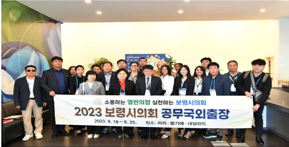
▲ 프랑스 국가고용공단 로비에서