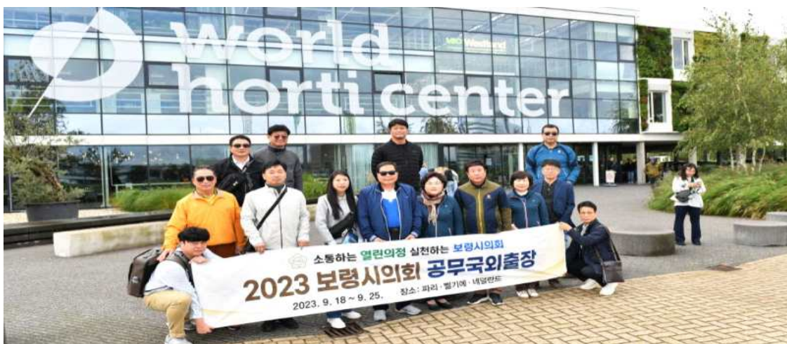
▲ 세계원에센터 앞에서