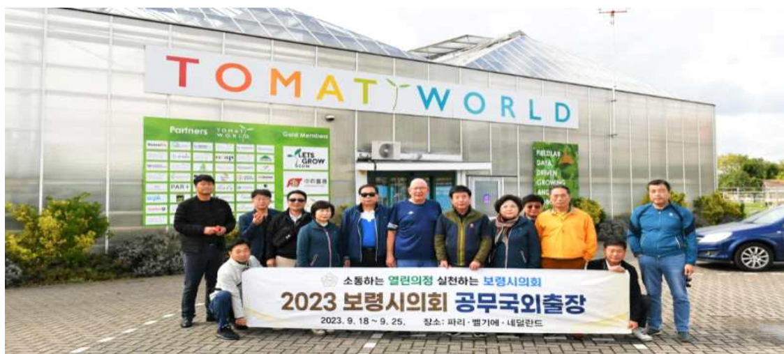
▲ 토마토월드 앞에서