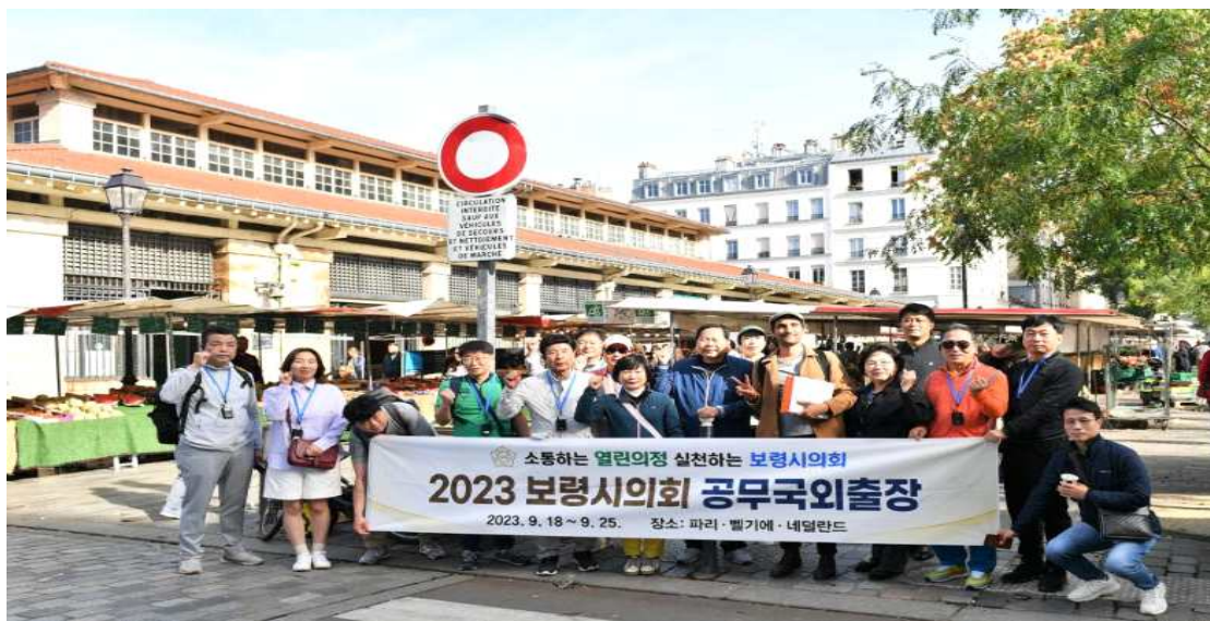
▲ 알레그레 시장 정문 앞에서