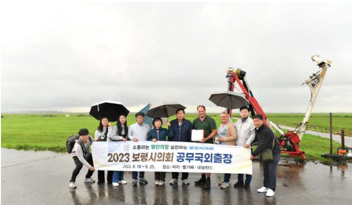
▲ 농장의 초원 앞에서